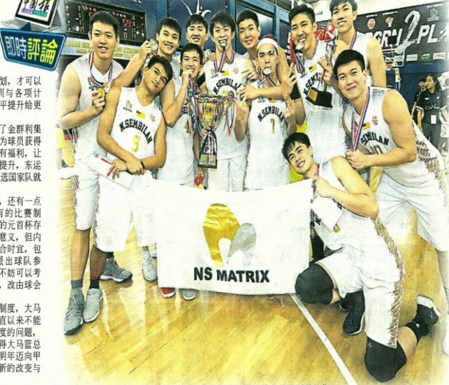
▲森美兰男队二连冠，全队球员开心拥著奖杯庆祝获得的最佳圣诞节礼物。