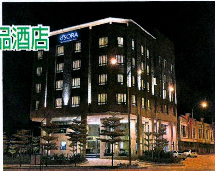
■美仑美奂的d' Sora精品酒店设在达城商业区。