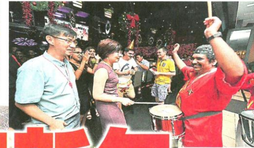
▲民众尽情享受倒数夜，随音乐节奏起舞。