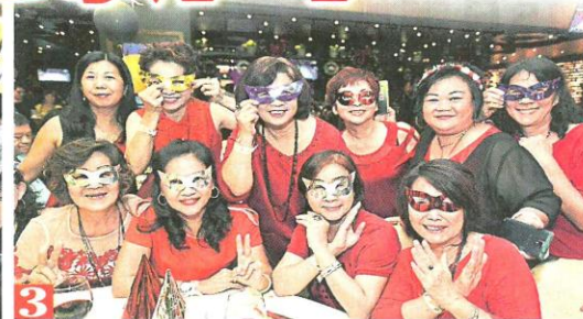
▲1.小丑先生扭出开心的造型气球，逗乐了小朋友。