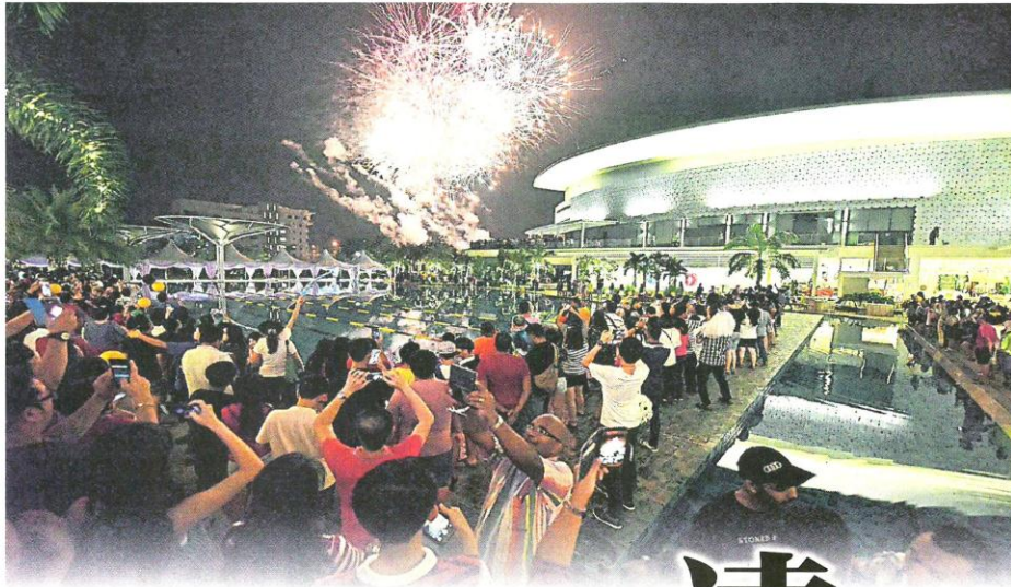
▲踏入2017年，烟火绽放，满场欢呼新年欢乐！

当然，在踏入午夜12时，d'Tempat还有烟火汇演，璀璨的烟火，照亮夜空，为2016年告别，迎接2017年的到来。