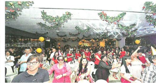
▲5000民众聚集达城d'Tempat迎新送旧，是森州跨年夜最大型的倒数活动。