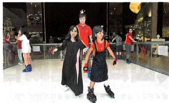
玩得不亦乐乎。参与溜冰活动的市民尤其是孩童