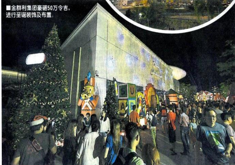
■金群利集团豪砸50万令吉,进行圣诞装饰及布置。