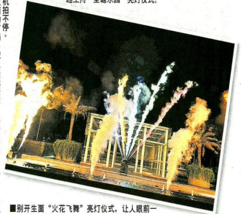
别开生面“火花飞舞”亮灯仪式，让人眼前一亮，非常精彩。