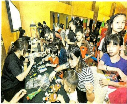
亲子关系，非常温馨及热闹。家长帶著孩子参加纸花工作坊，借此拉近