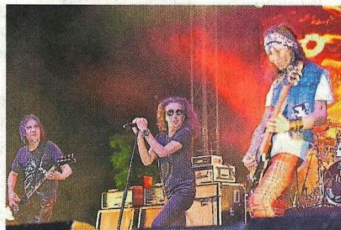
摇滚乐团通过摇滚歌曲，与出席者一起摇滚。