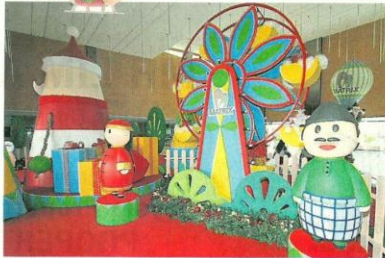
可爱的木偶，带出各族融洽相处的一面。