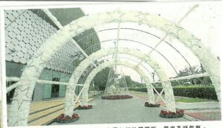
户外的“白色圣诞”，入夜时分，在霓虹灯的照耀下，带来圣诞气氛。