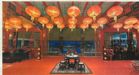
■粒粒大红灯笼高高挂，达城d'Tempat乡村俱乐部充满了新春气息。