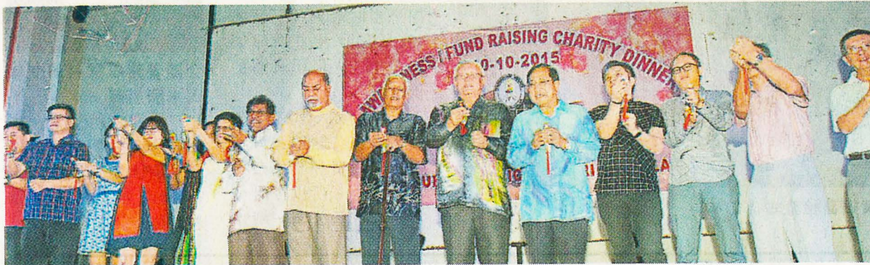
全体捐款者联合主持拉彩炮仪式。

他感谢金群利集团及金群利基金会、社会人士给予该中心大力支持，协助该中心筹得足够的经费，让他们能帮助更多需要帮助的病人。