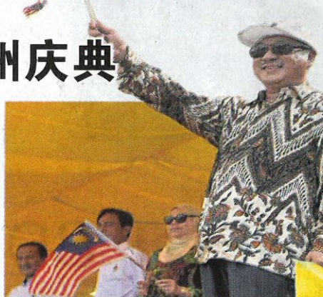
李典和联合嘉宾向参与游行的队伍挥旗致敬。

出席活动者包括森美兰最高统治者端姑慕赫力兹殿下、严端后端姑艾莎罗哈妮、森州大王子东姑阿里、二王子东姑再因、森州4大酋长、森州务大臣拿督斯里莫哈末哈山及夫人拿汀莎碧雅等。