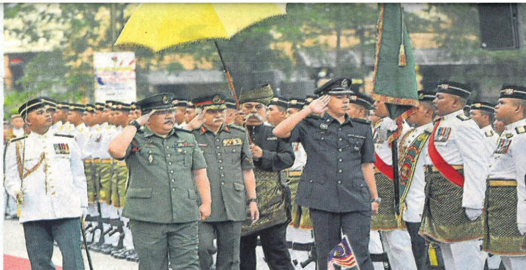
端姑慕赫力兹殿下 (中) 检阅仪仗部队。