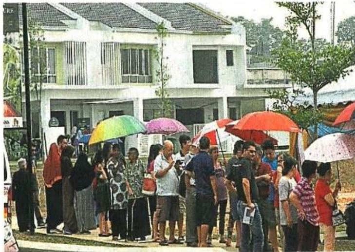
为了品尝猫山王，许多民众都愿意在艳阳下撑伞，耐心等待。