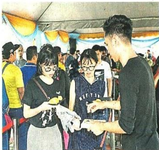
领取到猫山王的人，顿时食指大动。