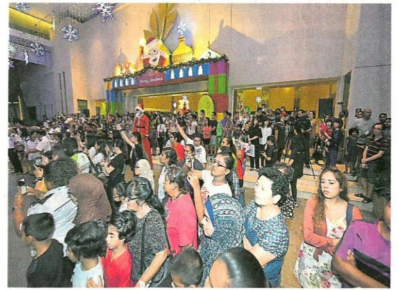
民众蜂拥到 dTempat 乡村俱乐部, 感染圣诞的欢乐气氛。