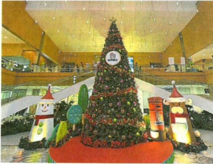
dTempat 乡村俱乐部散发着浓浓的佳节气氛。