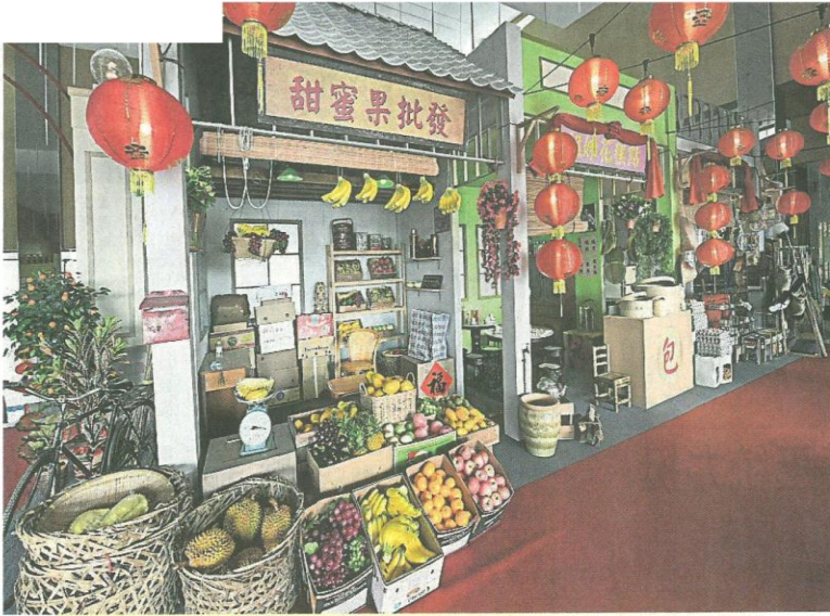
▲充满华人传统景色的复古商店，处处都是惊喜。