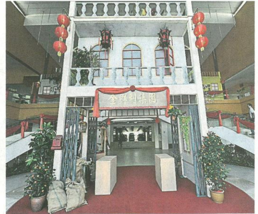
▲悬挂着金群利集团牌匾的港式唐楼，充满浓浓的历史感。